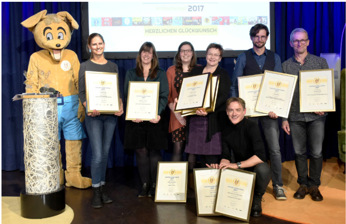
Foto von der AUDITORIX-Hörbuchsiegelvergabe am 3. November 2017